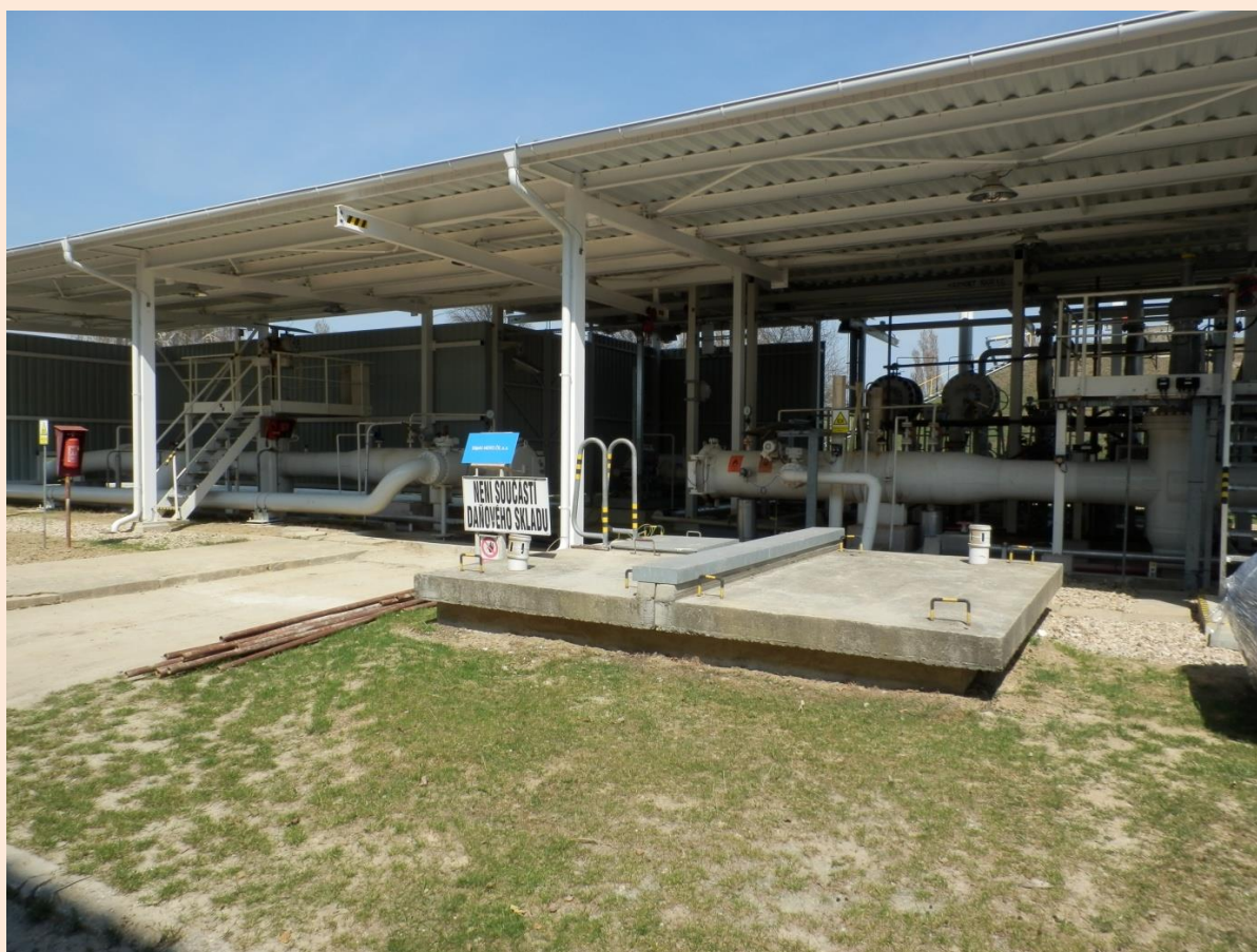
Ježkovací komory přečerpávací stanice

V případě většího rozsahu havárie (např. požár nebo výbuch), kdy společnost MERO ČR, a.s. Klobouky u Brna spol. s.r.o. není schopna vlastními silami a prostředky řešit havarijní situaci, spolupracuje a žádá o pomoc Integrovaný záchranný systém. Jednotlivé složky plní úkoly směřující k likvidaci mimořádné události na postiženém zařízení nebo k omezení jejich následků.