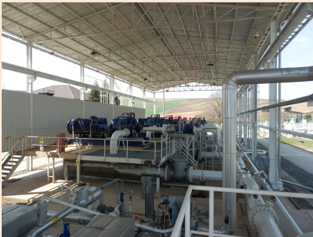
Hala s čerpadly přečerpávací stanice