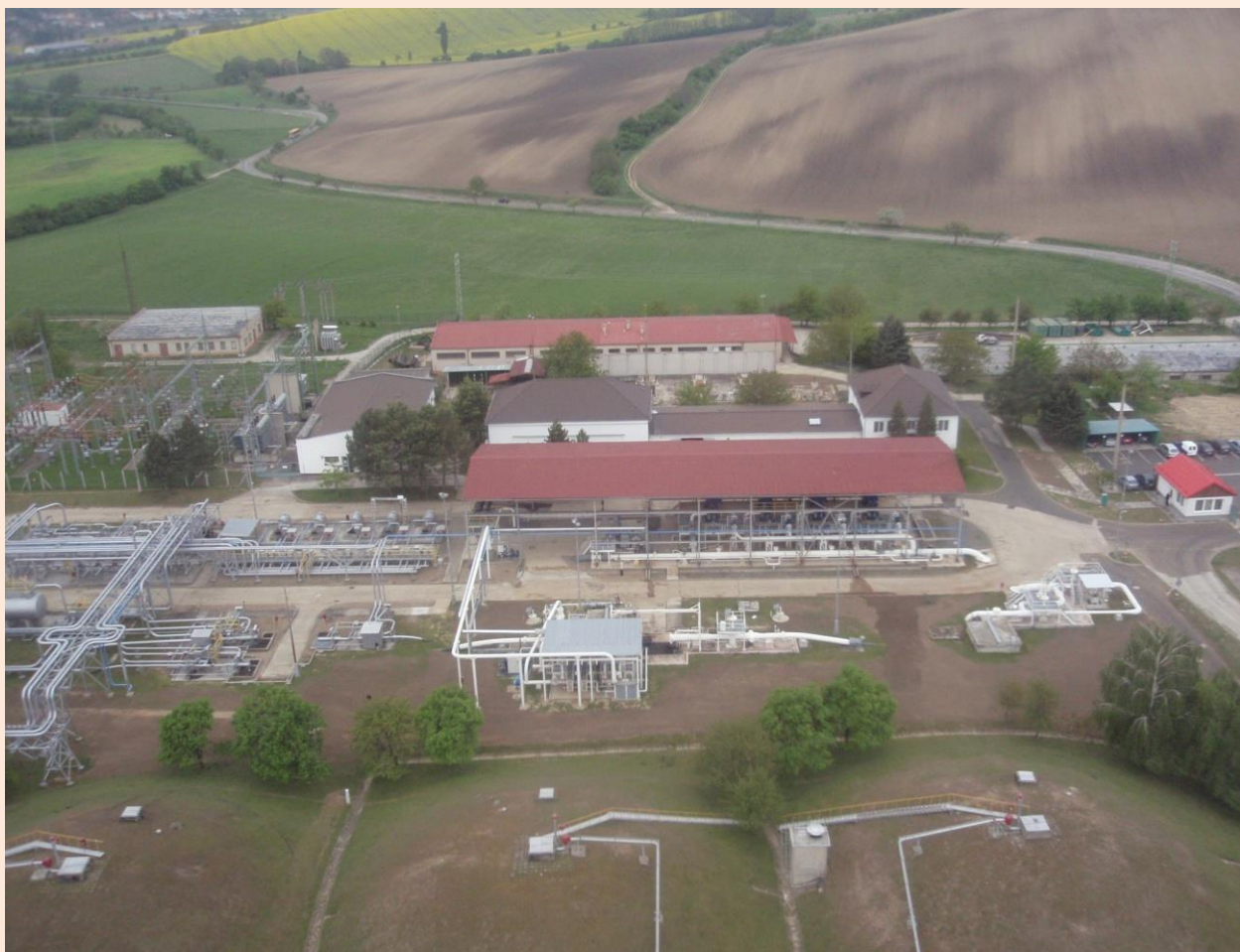
Celkový pohled na přečerpávací stanici Klobouky u Brna

Ropa je v objektu pouze přečerpávána, nedochází k žádným výrobním procesům, ani ke vzniku meziproductů, popřípadě jiných produktů vzniklých mimo jiné neřízenými chemickými procesy.